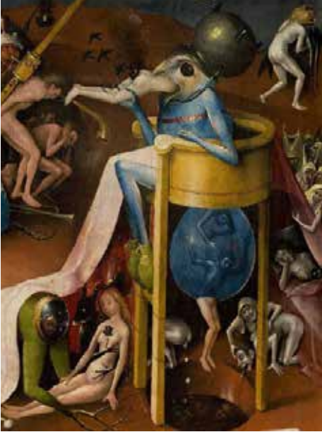
© Jérôme Bosch, Le jardin des délices