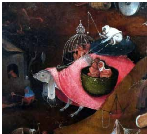
© Jérôme Bosch, Le dernier jugement de Bruges