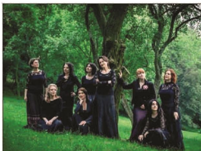
L'ensemble tchèque Tiburtin, sur scène le 14 septembre.