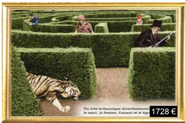
Un très britannique divertissement: le mari, la femme, l'amant et le tigre du Bengale.