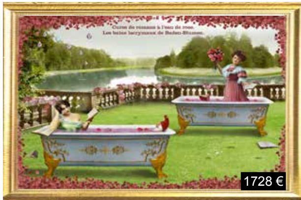
Cures de romans à l'eau de rose. Les bains lacrymaux de Baden-Blumen.