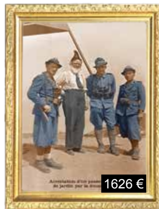
Arrestation d'un passeur de nains de jardin à la douane Suisse.