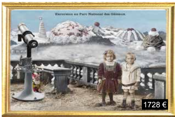
Excursion au Parc National des Gâteaux.