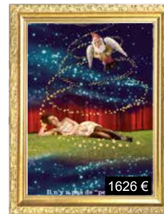
Il n'y a pas de «petits clients».