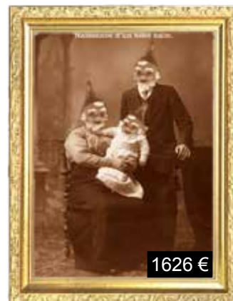
Naissance d'un bébé nain.