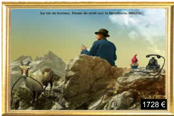
La vie de bureau. Pause de midi sur le Spitzhorn, 3652m.