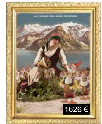
Le garage des nains fermiers.