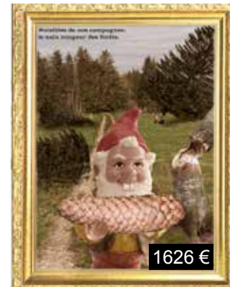
Nuisibles de nos campagnes: le nain rongeur des forêts.