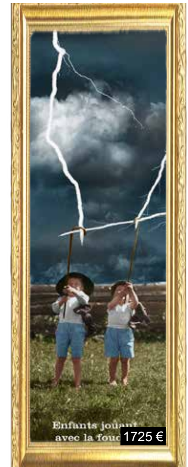
Enfants jouant avec la foudre.