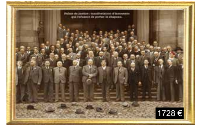
Palais de justice: manifestation d'innocents qui refusent de porter le chapeau.