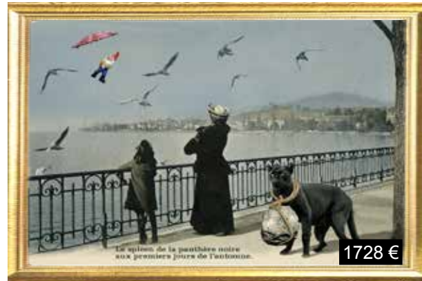
Le spleen de la panthère noire aux premiers jours de l'automne.